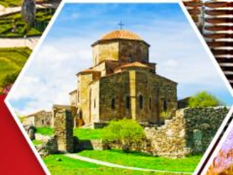
วิหารกออาร์