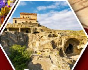
เมืองถ้ำอพลิสตซ์เคห์

พัก Rooms Hotel โรงแรมวิวหลักล้านของเทือกเขาคอเคซัส