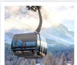
ขึ้นกระเช้ายอดเขาจุงเฟรา