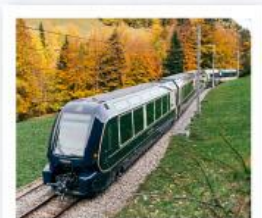
รถไฟโกลด์นพาส