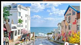
ถนนคอปเปลิ่งสาขาที่เปิด