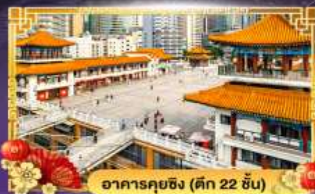
อาคารคุยฉิง (ตึก 22 ชั้น)