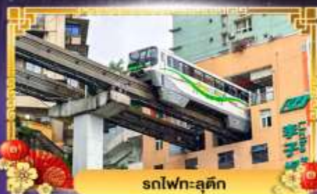
รถไฟฟ้า-ลู่ติง