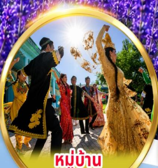
หมู่บ้าน วัฒนธรรมอูยгур