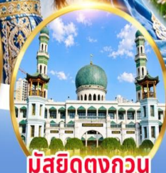
มัสยิดตงกอน