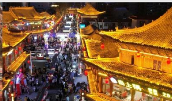
ตลาดกลางคืนจางเย่

*ทางบริษัทฯ ขอสงวนสิทธิ์ในการสลับโปรแกรมทัวร์ตามความเหมาะสมขึ้นอยู่กับสถานการณ์หน้างาน โดยคำนึงถึงผลประโยชน์ของลูกค้าเป็นสำคัญ