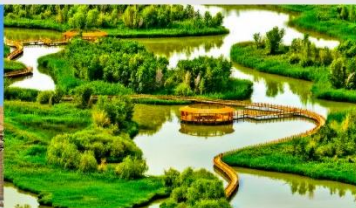
อุทยานพื้นที่ชุ่มน้ำจางเย่