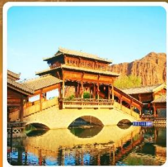
เมืองเล็กตันเสี่ยโซ่ว