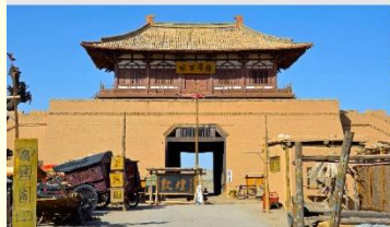
เมืองโบราณตุนหวง