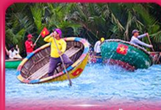
ส่องเรือกระดัง หมู่บ้านกิมทาน