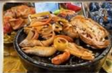
ปิ้งย่าง