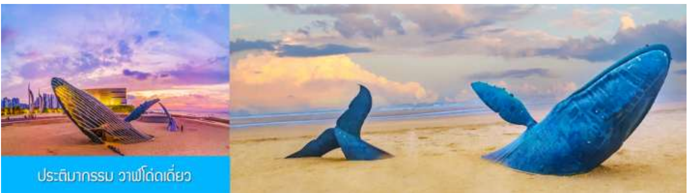
ประติมากรรม วาฬโดดเตี๋ย

นำท่านชมซุ้มประตูผิงไหล พระราชวังมังกง พระราชวังราชินีแห่งสวรรค์ และศาลาหลัก ชมทัศนียภาพอันตระการตาของเขตแดนทะเลเหลือง-ทะเลป้อไห่ ชม " ศาลาอมตะทะเลยานสู่ท้องฟ้า " จากนั้นนำท่านเดินทางไปยัง จุดชมวิวแปดเซียนข้ามทะเล ชมสถานที่สำคัญอันเป็นสัญลักษณ์ เช่น หอคอยเซียนหยวน กำแพงแปดเซียน และศาลาสู่เซียน โครงสร้างรูปทรงน้ำเต้าที่ล้อมรอบด้วยทะเลทั้งสามด้าน เชื่อมโยงตำนานแปดเซียนเข้ากับ ความมหัศจรรย์ของภาพลวงตา