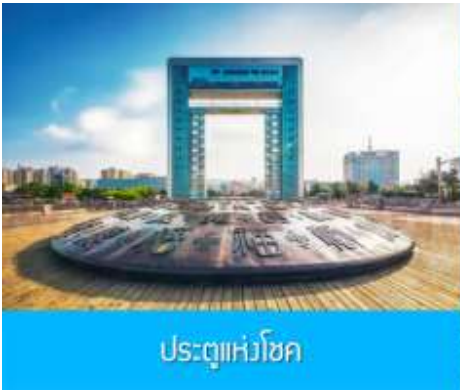
ประตูแห่งโชค

ครบรอบ 100 ปี ของการเปิดท่าเรือเว่ยไห่ จึงขนานนามว่าเป็น ประตูแห่งโชคกลาง ที่คอยต้อนรับนักท่องเที่ยวทุกท่าน โครงสร้างของประตูที่ตั้งตระหง่าน โอบล้อมของท้องทะเลและเกาะหลิวกง อยู่เบื้องหน้า เป็นภาพที่สวยงาม ให้ท่านเก็บบรรยากาศเป็นที่ระลึก จากนั้นเดินทางสู่ภัตตาคาร