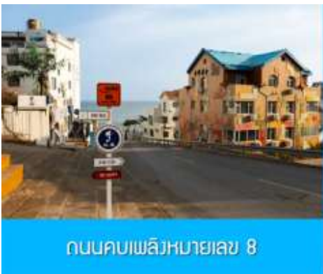
ถนนคบเพลิงหมายเลข 8

นำท่านจิบไวน์ในปราสาทสไตล์ยุโรป หลีกหนีความวุ่นวายและก้าวเข้าสู่ดินแดนที่ราวกับหลุดมาจากเทพนิยายยุโรป ณ ไร่ไวน์ ชาโตว์ ณ คฤหาสน์ จางยู๋ ปราสาทไวน์อัน โอ่อ่าที่ตั้งตระหง่านกลาง ไร่องุ่นสุดลูกหูลูกตาในเมืองเยียนไถ มณฑลซานตง ที่นี่คือการบรรจบกันอย่างลงตัวของมรดกการผลิตไวน์กว่าร้อยปีของจีนและความเชี่ยวชาญจากฝรั่งเศส ทำให้เกิดเป็นแหล่งท่องเที่ยวที่ไม่เพียงสวยงามน่าถ่ายรูป แต่ยังเป็นสวรรค์ของคนรักไวน์ นำท่านเดินชมสถาปัตยกรรมคลาสสิก เยี่ยมชมห้องเก็บไวน์ใต้ดินอันลึกลับ และปิดท้ายด้วยการชิมไวน์รสเลิศที่ผลิตจากองุ่นในไร่แห่งนี้ เสริมแต่งประสบการณ์ที่จะทำให้การเดินทางของคุณพิเศษยิ่งขึ้น ปิดท้ายประสบการณ์อันสุดแสนคลาสสิกนี้... ด้วยการ ลิ้มรสไวน์แดง (ท่านละ 1 แก้ว) ที่มีชื่อเสียงของที่นี่, จากนั้น นำท่านเดินทางสู่ เมืองเวย์ไห้ 威海 ตั้งอยู่ปลายสุดของคาบสมุทรซานตง ซึ่งเป็นเมืองท่าสำคัญที่มีชายฝั่งทะเลสวยงามสะอาด อากาศเย็นสบายในฤดูร้อนและมีหิมะตกหนักในฤดูหนาว ได้รับอิทธิพลวัฒนธรรมเกาหลีได้เนื่องจากที่ตั้งใกล้ที่สุด จุดเด่นคือเกาะหลิวกง เมืองหัวเซี่ยเฉิง และบรรยากาศเมืองท่าที่พักผ่อนสบาย นำท่านเก็บบรรยากาศกับ กรอบรูปวิวทะเล อีกหนึ่งไฮไลท์สุดฮิตที่มาเวย์ไห้ ต้องถ่ายรูปกับจุดนี้