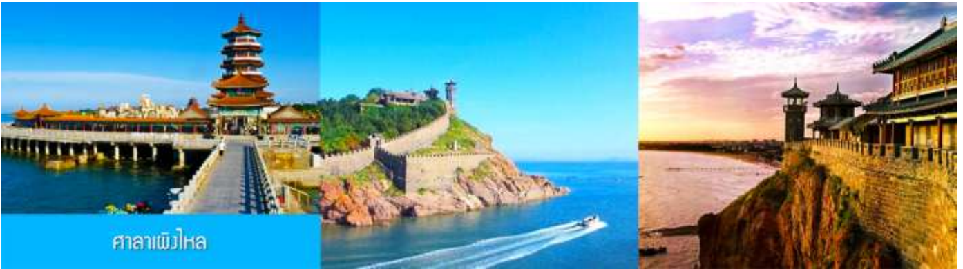
ศาลาเพิงไหล

จนได้เวลาอันสมควรนำท่านเดินทางสู่ คฤหาสน์เหวินเจิง 文成城堡 คฤหาสน์สไตล์ยุโรป ที่ตั้งตระหง่านอยู่ริมทะเลในเมืองเยียนไถ ที่นี่ไม่ใช่แค่สถาปัตยกรรม แต่คือ ประตูลูกโลกแห่งจินตนาการที่ท่านจะได้สัมผัสความหรูหรา และได้สัมผัสกับสถาปัตยกรรมสไตล์บารอกที่ยิ่งใหญ่ เหมือน หลุดเข้าไปในเทพนิยายของยุโรป ให้ท่านเก็บภาพบรรยากาศตามอัธยาศัย จนได้เวลาอันสมควร นำท่านเดินทางสู่ภัตตาคาร