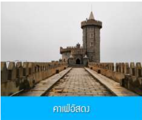
คาเฟ่อีสต