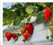
สวนสตรอว์เบอร์รี่