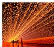
นานา: โนะ ซาโต: