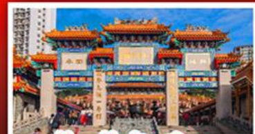
วัดเขว้งต้าเซียน