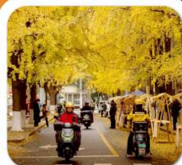
"ถนนแปะก๊วย"

นั่งกระเช้าชมภูเขาหวงอู่ซาน ขุนเขาใบไม้แดงอันดับหนึ่งของประเทศจีน เมืองชู่หยหนิง วัดหลิงจวน (วัดเจ้าแม่กวนอิมกะพริบตา) - พาสินแกะสลักต้าจู้ หงหยาดัง ถนนแปะก๊วย ดึกตะเกียบ วัดหลัวซัน ล่องเรือชมวิวฉงชิ่ง