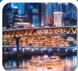
"ล่องเรือชมหงหยาดัง"