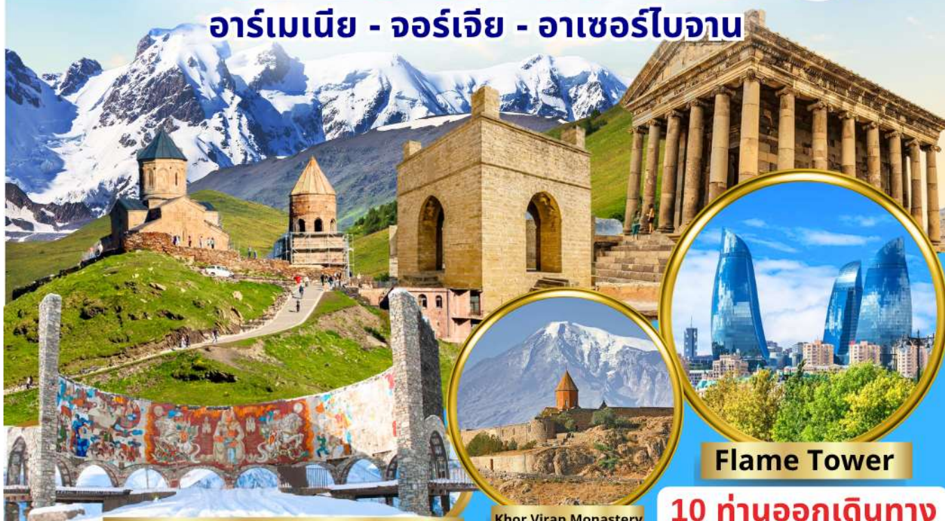
Georgian-Russian Friendship Monument