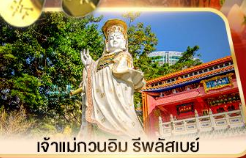
เจ้าแม่กวนอิม ธิพลสมัย