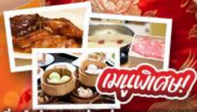
ต้มยำฮ่องกง, ห่านย่าง และอาหารชาบู

วัดเจ้าแม่กวนอิมฮ่องกง - กระเช้ามองปิง พระใหญ่โป้วหลิน - เจ้าแม่กวนอิมรัฟลีสเบย์ วัดแชกงหมิว - วัดหวังต้าเซียน - วัดเจ้าแม่ทับทิม