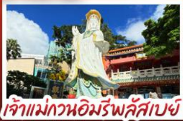
เจ้าแม่กวนอิมรัฟลีสเบย์