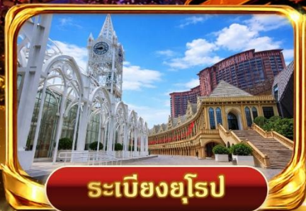
ระเบียงยุโรป

QINGDAO INTERNATIONAL BEER FESTIVAL 2026