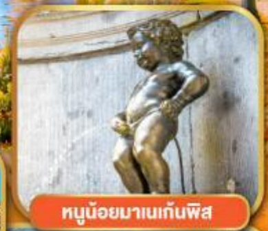
ทูน้อยมาบเทินพิส