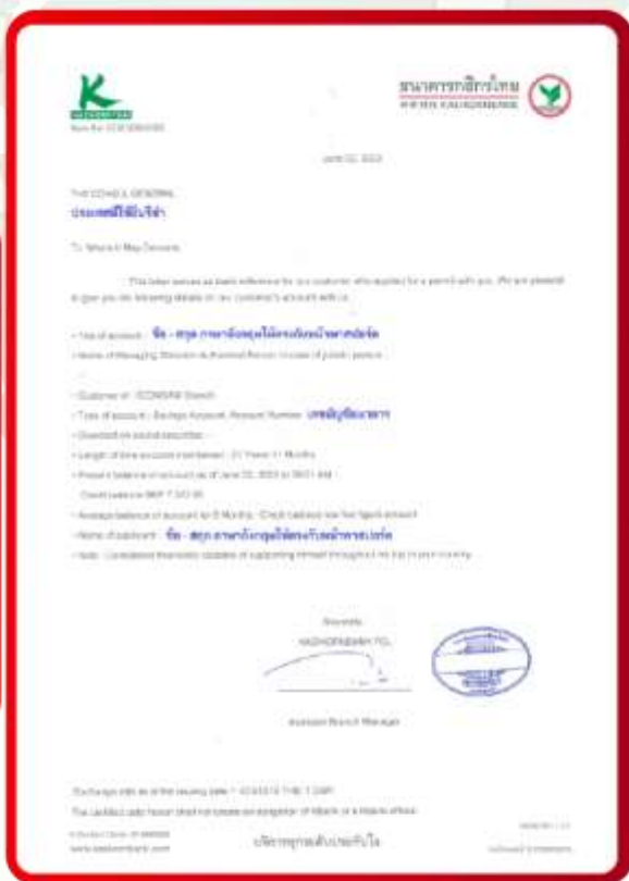
ตัวอย่าง Bank Guarantee ที่ผู้สมัครต้องส่งกับธนาคาร