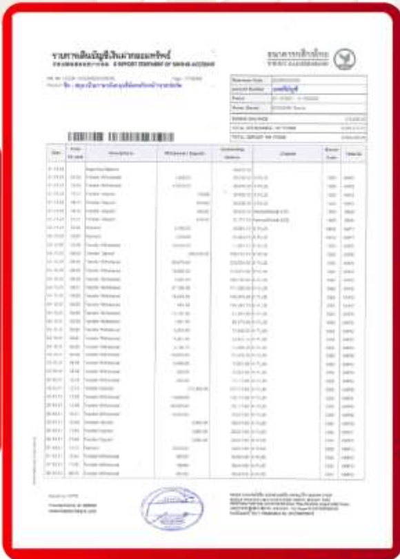
ตัวอย่าง Bank Statement ที่ผู้สมัครต้องส่งกับธนาคาร

สามารถเพิ่มบัญชีอื่นๆ หรือบัญชีเงินเก็บ (ที่มีการเคลื่อนไหว) เช่น ฝากประจำ, สลากธนาบัตร, ใบซื้อหุ้น แนบประกอบได้