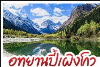
อุทยานปี่ผิงโกว