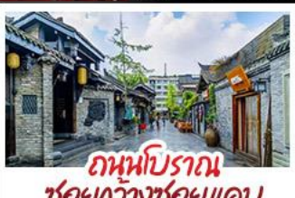
ถนนโบราณ ชอยกว้างชอยแคบ