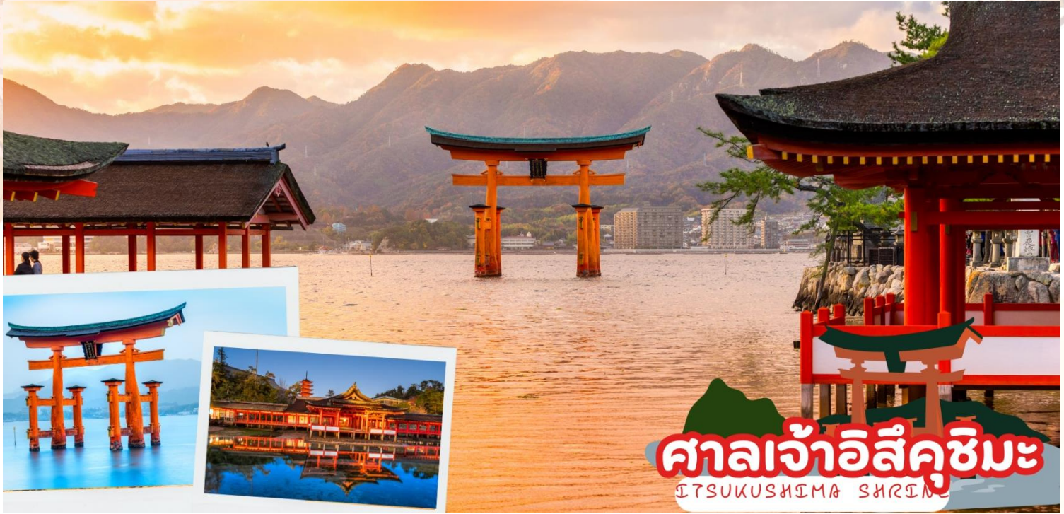
ศาลเจ้าอิสุคุชิมะ ITSUKUSHIMA SHRINE

ศาลเจ้าจะเหมือนเรือขนาดยักษ์ที่ลอยน้ำอยู่ ศาลเจ้าแห่งนี้ได้รับการขึ้นทะเบียนเป็นมรดกโลกในปี พ.ศ. 2539 และรัฐบาลญี่ปุ่นได้ยกฐานะให้เป็นสมบัติประจำชาติ