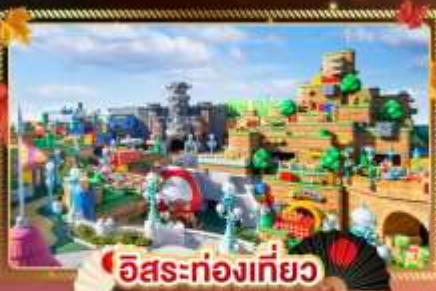
อิสระท่องเที่ยว