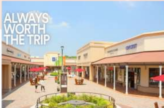
SHOPPING AT SHISUI PREMIUM OUTLETS