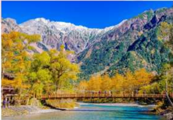
KAMIKOCHI SWITZERLAND OF JAPAN