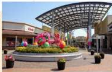
SHOPPING AT SHISUI PREMIUM OUTLETS