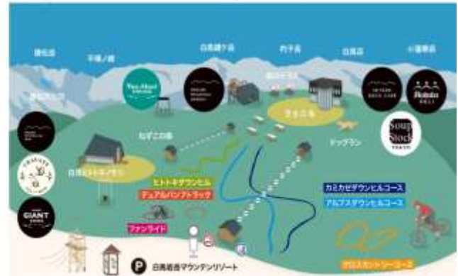
HAKUBA IWATAKE MOUNTAIN