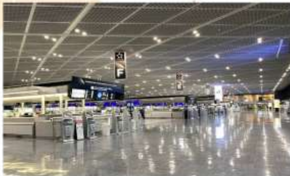
NARITA INTERNATIONAL AIRPORT

“สนามบินนานาชาตินาริตะ” เป็นสถานที่ที่นักท่องเที่ยวส่วนใหญ่จะได้สัมผัสเป็นที่แรกหลังจากมาถึงญี่ปุ่น ที่นี่เป็นสนามบินที่ทันสมัย สะดวกสบาย และได้รับการออกแบบมาเป็นอย่างดี อาคารผู้โดยสารหลักสองแห่งมีทั้งร้านค้า ร้านอาหาร พื้นที่นั่งรอสุดผ่อนคลาย หอชมทิวทัศน์ และกิจกรรมต่างๆ ที่จะให้คุณเพลิดเพลินอยู่ตลอด