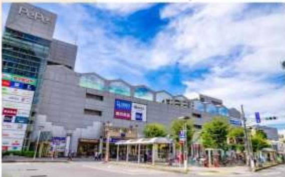
SHOPPING AT SHINJUKU