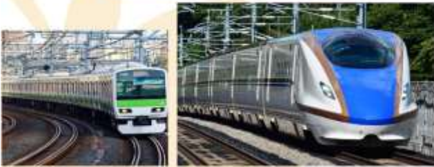
TAKE BULLET TRAIN

เดินทางด้วย "รถไฟชินคันเซ็น" ไปยัง "สถานีรถไฟโอมิยะ" เป็นการเดินทางที่รวดเร็ว สะดวกสบาย และปลอดภัย รถไฟชินคันเซ็นเป็นรถไฟความเร็วสูงของญี่ปุ่น มีความทันสมัยและมีเทคโนโลยีที่ล้ำสมัย ทำให้การเดินทางของคุณเป็นไปอย่างราบรื่นและถึงที่หมายตรงเวลา จากนั้นเปลี่ยนขบวนรถไฟเป็น "รถไฟท้องถิ่น" เพื่อมุ่งหน้าสู่ "สถานีรถไฟชินจูกุ"