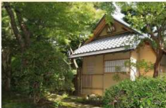
TEA CEREMONY AT SUIKOAN