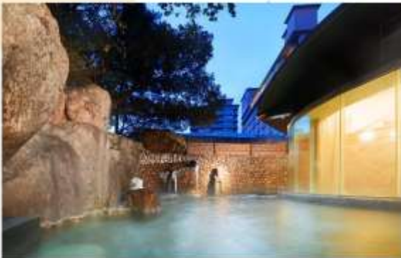
GERO HOT SPRINGS HOTEL SUIMEIKAN

“เทโร- อมเซ็น” เป็นหนึ่งในสามบ่อน้ำพุร้อนที่ดีที่สุดของญี่ปุ่น ตั้งอยู่ในจังหวัดกิฟุ มีชื่อเสียงโด่งดังมาช้านานหลายศตวรรษในฐานะ: “บ่อน้ำแห่งความงาม” หรือ “Bijik no Yu” เนื่องจากน้ำแร่บริสุทธิ์ของที่นี่มีสรรพคุณช่วยบำรุงผิวพรรณให้เนียนนุ่ม เมืองอมเซ็นแห่งนี้ตั้งอยู่ริมแม่น้ำอิดะ รายล้อมด้วยทิวทัศน์ธรรมชาติอันงดงาม