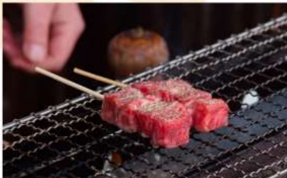
HIDA BEEF GRILLED