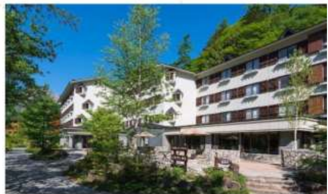
KAMIKOCHI LEMEIESTA HOTEL