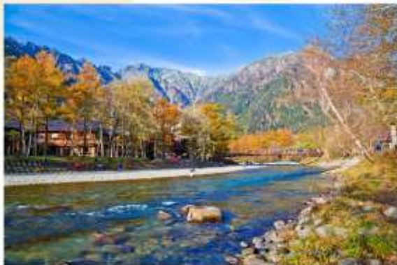
KAMIKOCHI SWITZERLAND OF JAPAN