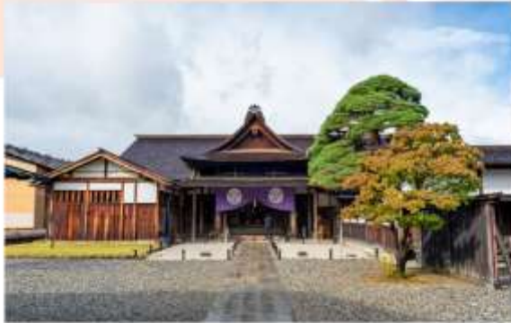
OLD GOVERNMENT TAKAYAMA