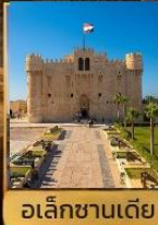
อเล็กซานเดีย