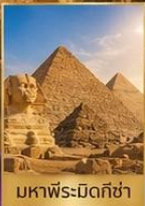
มหาพีระมิดกิซ่า