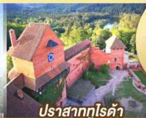
ปราสาทกูไรต้า