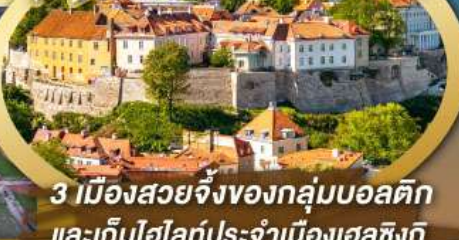
3 เมืองสวยจิ้งของกลุ่มบอลติก และเก็บไฮไลท์ประจำเมืองเอสซิงกิ และล่องเรือเฟอร์รี่ข้ามประเทศ

ไฮไลท์ในโปรแกรม • เที่ยวสามประเทศหลักกลุ่มบอลติก • ชมเมืองหลวงวิลนิอุส ประเทศลัตเวีย