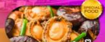
พิเศษเมนู หอยเป๋าฮื้อ เดินทาง มีนาคม 69