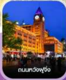
ถนนทงฟู่จิ้ง