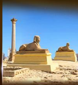
เสาสีบีนปอนเบย์