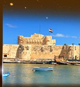
บึงนรากรม Quite Bay