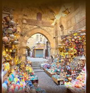
ตลาดงานเวลคาส์