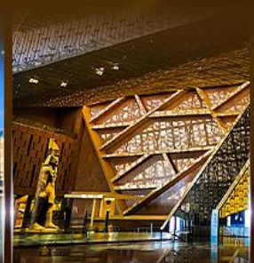
พิพิธภัณฑ์ไทรนด์อียิปต์ (GEM)