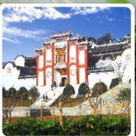
บ้านเกิดชวีหยวน