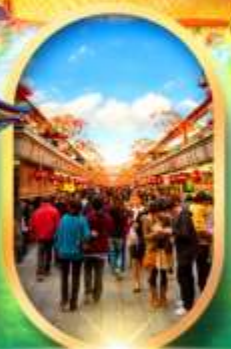
ถนนนากามิเสะ