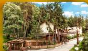
Oi-Qaragai Mountain Resort