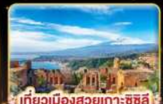
เที่ยวเมืองสวยเกาะซซิลี Taormina