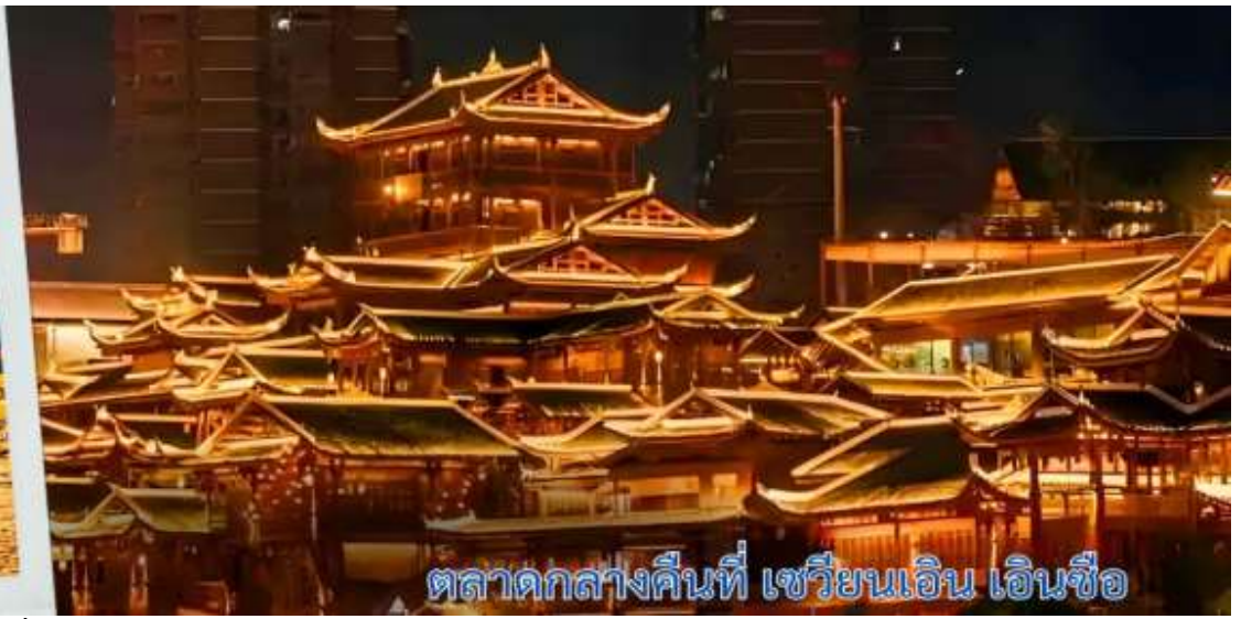
ตลาดกลางคืนที่ เซวียนเอน เอนซือ