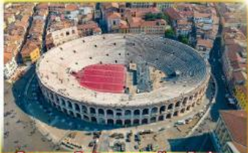
โรงละครโรมันกลางจัหวโรม่า