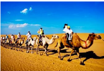
เนินทรายเสียงซาวาน

เที่ยง รับประทานอาหารกลางวัน ณ ภัตตาคาร (5)