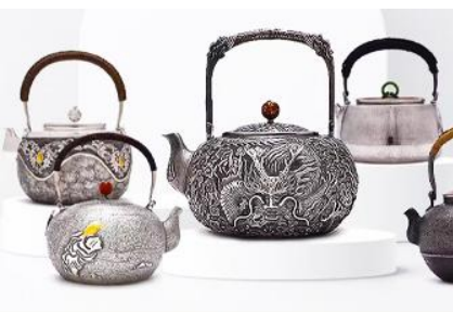
พิพิธภัณฑ์เครื่องปั้นของโกล