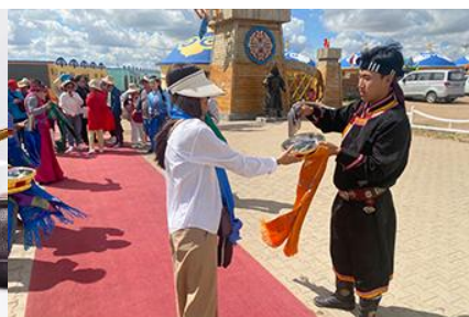
พิธีต้อนรับแขกด้วยเหล้า