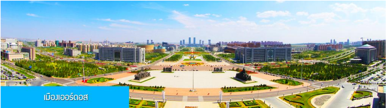
เมืองออร์ดอส