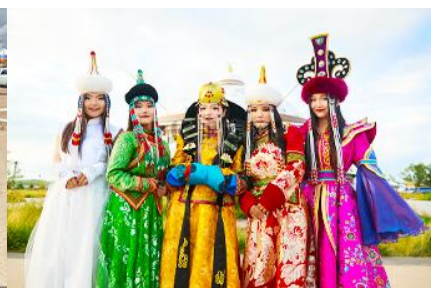
แต่งชุดพื้นเมืองมองโกล