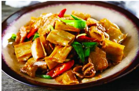
ถนนคนเดินเออร์ดอส

จากนั้นนำท่านเที่ยวชม อุทยานคังปาสือ 康巴什景区 เป็นเขตเมืองใหม่ที่ถูกเนรมิตขึ้นและได้รับการขึ้นทะเบียนเป็นอุทยานท่องเที่ยวระดับ 4A และเป็นศูนย์กลางความเจริญของเมืองเออร์ดอส ประกอบด้วยจัตุรัส ซิมปาร์ค พิพิธภัณฑ์ แกรนด์เธียร์เตอร์ ศูนย์วัฒนธรรม และสนามแข่งรถนานาชาติ นำท่านนั่งรถผ่านชมจัตุรัสรัฐบาล ทะเลสาบอุหลันมู่ สวนศิลปะงานปาติมากรรมเอเชีย ฯลฯ