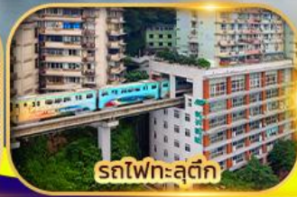
รถไฟฟ้าเซ่ตัก