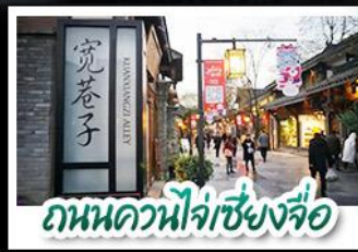
ถนนควนหนี่จู่เซียงจื่อ