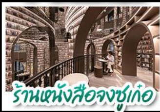
ร้านหนังสือจชชู่เก๋อ

อุทยานสี่ดรุณี - อุทยานป่ิงเฟิงโกว - วัดต้าฉือ หมีแพนด้าบนเนินเซฟี่ - ร้านหนังสือจชชู่เก๋อ ถนนโบราณชอยกวางชอยแคบ ช้อปปิ้งถนนไท่กู่หลี่ + ถนนชุนชู่ CHENGDU TIMES OUTLETS