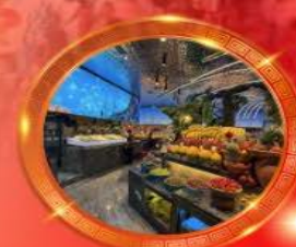
บุฟเฟต์หม้อไฟลงชิง