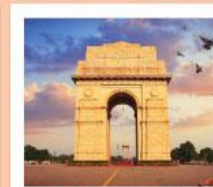
♥♥♥ India Gate