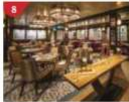
8 Bistro By Mark Best Relish contemporary Western cuisine from the internationally-acclaimed Australian chef.