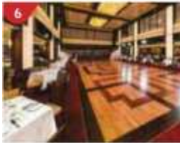
6 Dream Dining Room Savour a wide variety of Asian and international cuisine.