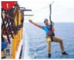
1 Ropes Course & Zipline Feel the thrill of gliding above the ocean on a 35-metre zipline.