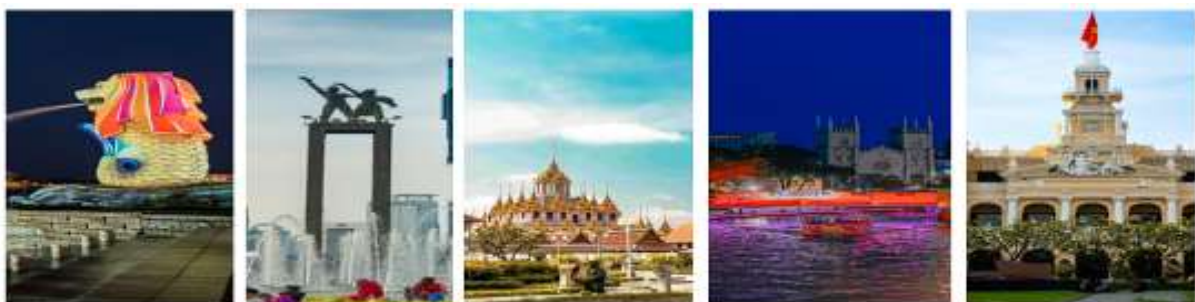
Package เรือสำราญ เดินทางด้วยตัวเอง (Cruise Only)