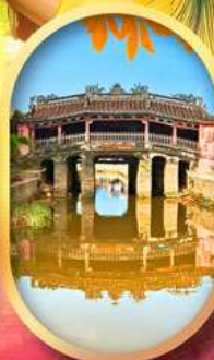
เมืองเก่าฮอยอัน