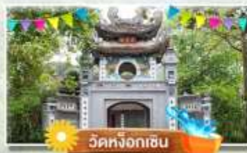
วัดหิ่งกัซัน