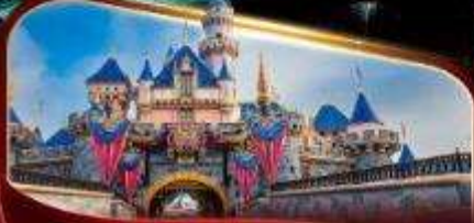
ดิสนีย์แลนด์ปาร์ค