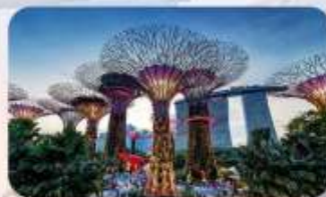
Gardens by the Bay