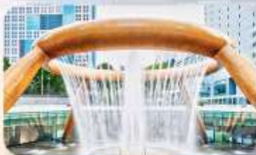
Fountain of Wealth