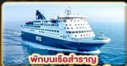
พักผ่อนเรือสำราญ แบบ Window Room 1 คืน