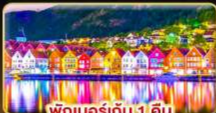
พักเบอร์เกน 1 คืน