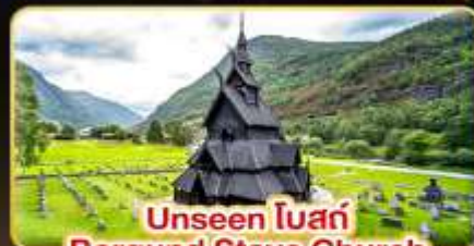
Unseen โบสถ์ Borgund Stave Church