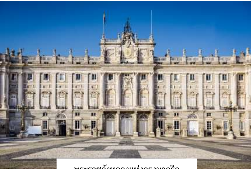
พระราชวังหลวงแห่งกรุงมาดริด (Royal Palace of Madrid)

นำท่านเข้าชม พระราชวังหลวงแห่งกรุงมาดริด (Royal Palace of Madrid) (ขอสงวนสิทธิ์ในการงดเข้าชมภายในพระราชวัง ในกรณีที่มีการจัดพิธีการสำคัญหรือกิจกรรมของราชสำนัก โดยอาจปรับเปลี่ยนโปรแกรมเข้าชมพระราชวังอื่นแทน) พระราชวังหลวงแห่งนี้ตั้งอยู่บนเนินเขาริมแม่น้ำแมนซานาเรส (Manzanares) โดดเด่นด้วยความโอ้อ่า สง่างาม และงดงามไม่แพ้พระราชวังใดในทวีปยุโรป เริ่มก่อสร้างในปี ค.ศ. 1738 ด้วยวัสดุหินทั้งหลัง ภายใต้สถาปัตยกรรมแบบบาร็อคผสมผสานระหว่างศิลปะฝรั่งเศสและอิตาลีอย่างลงตัว ภายในพระราชวังประกอบด้วยห้องต่าง ๆ มากกว่า 2,830 ห้อง ที่ได้รับการตกแต่งอย่างวิจิตรบรรจง ทั้งยังเป็นที่เก็บรักษาผลงานศิลปะชิ้นสำคัญจากจิตรกรชื่อดังในยุคนั้น