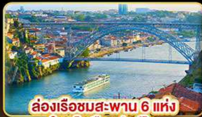
ล่องเรือชมสะพาน 6 แห่ง ในคูโรเมืองปอร์โต