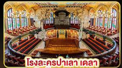
โรงละครปาลาเลา เดลา มูสิกา คาสาลานา