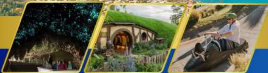
ถ้ำหอนเรื่องแสง หมู่บ้านฮ็อบบิต เล่นลู่ที่ควีนส์ทาวน์

10-19 ตุลาคม 2569 17-26 ตุลาคม 2569 14-23 พฤศจิกายน 5-14 ธันวาคม 2569 (วันพ่อแห่งชาติ)