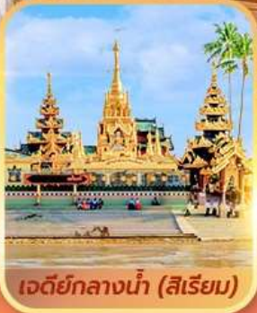
เจดีย์กลางน้ำ (สิริเยม)