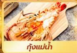
กุ้งแม่น้ำ