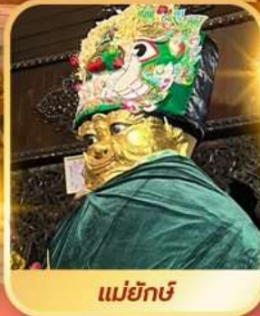
แม่ยักษ์