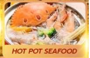
HOT POT SEAFOOD