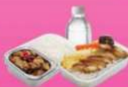
บริการอาหารร้อนบนเครื่อง ซาโป - ซากสับ