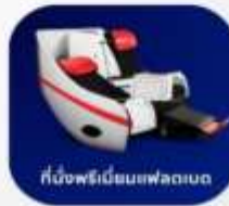
ที่นั่งพรีเอมียมเฟลตเบด