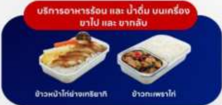
บริการอาหารร้อน และ น้ำดื่ม บนเครื่อง ชาไป และ ขากลับ